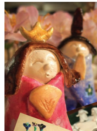
粘土細工 ひな人形 鯉のぼり 花瓶